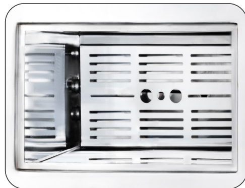
نمای داخلی مخزن